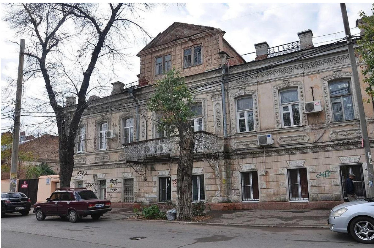
Дом купца Степанова, ул. Кр. Набережная, 40

С этого времени за домом закрепились печальные воспоминания.