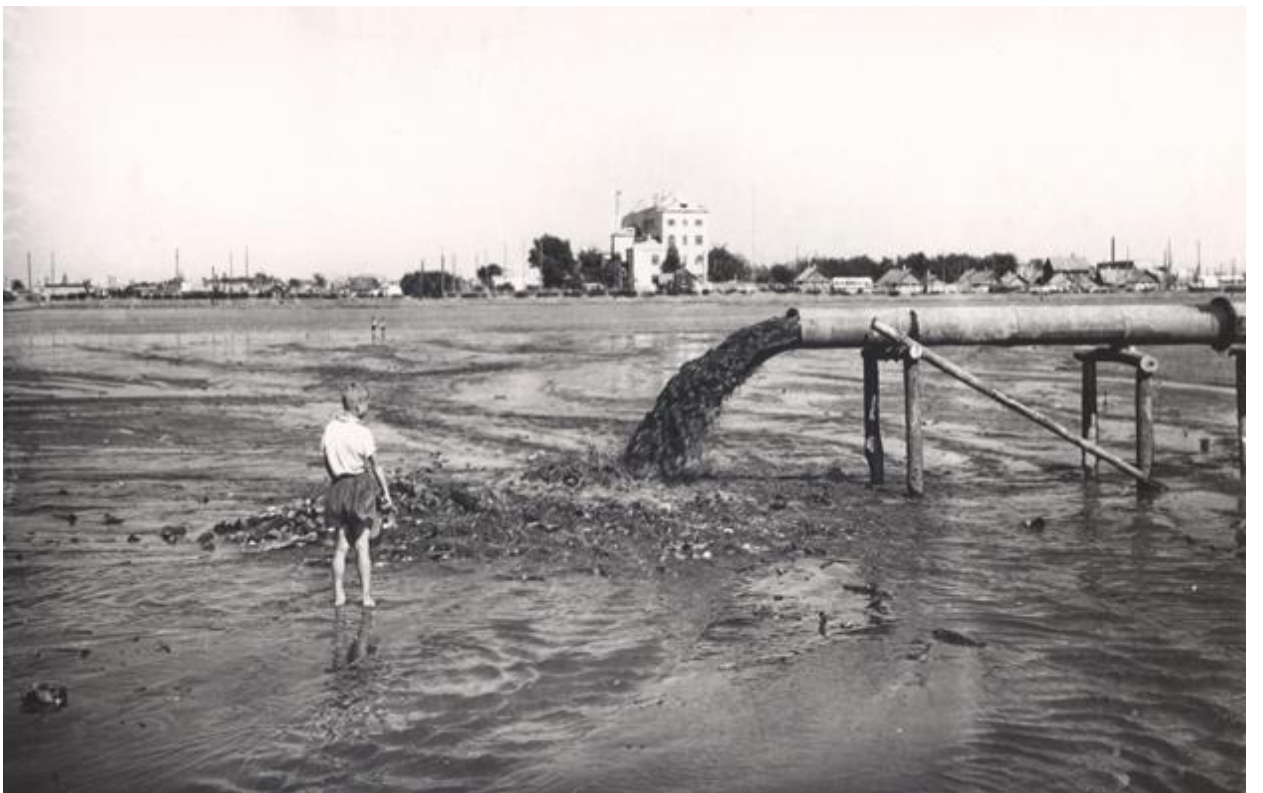
В поисках новых находок...