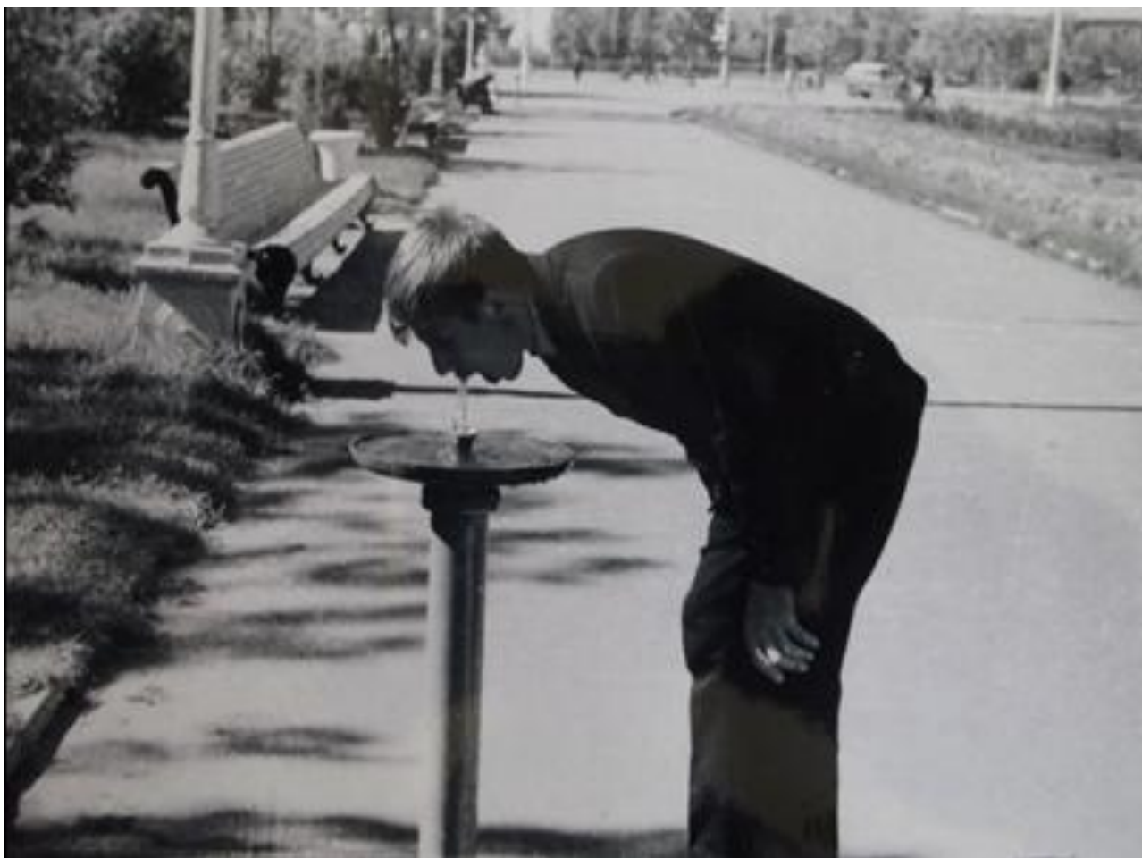
Площадь им. В.И. Ленина

В Астрахани не только газированные автоматы стояли, были и так называемые в народе «автопоилки», установленные во многих городских общественных местах: на площади Ленина, 17-ой пристани, в Аркашке, на вокзале. В жаркий день можно было просто подойти к автопоилке, из которой постоянно подавалась вода, утолить жажду и идти дальше.