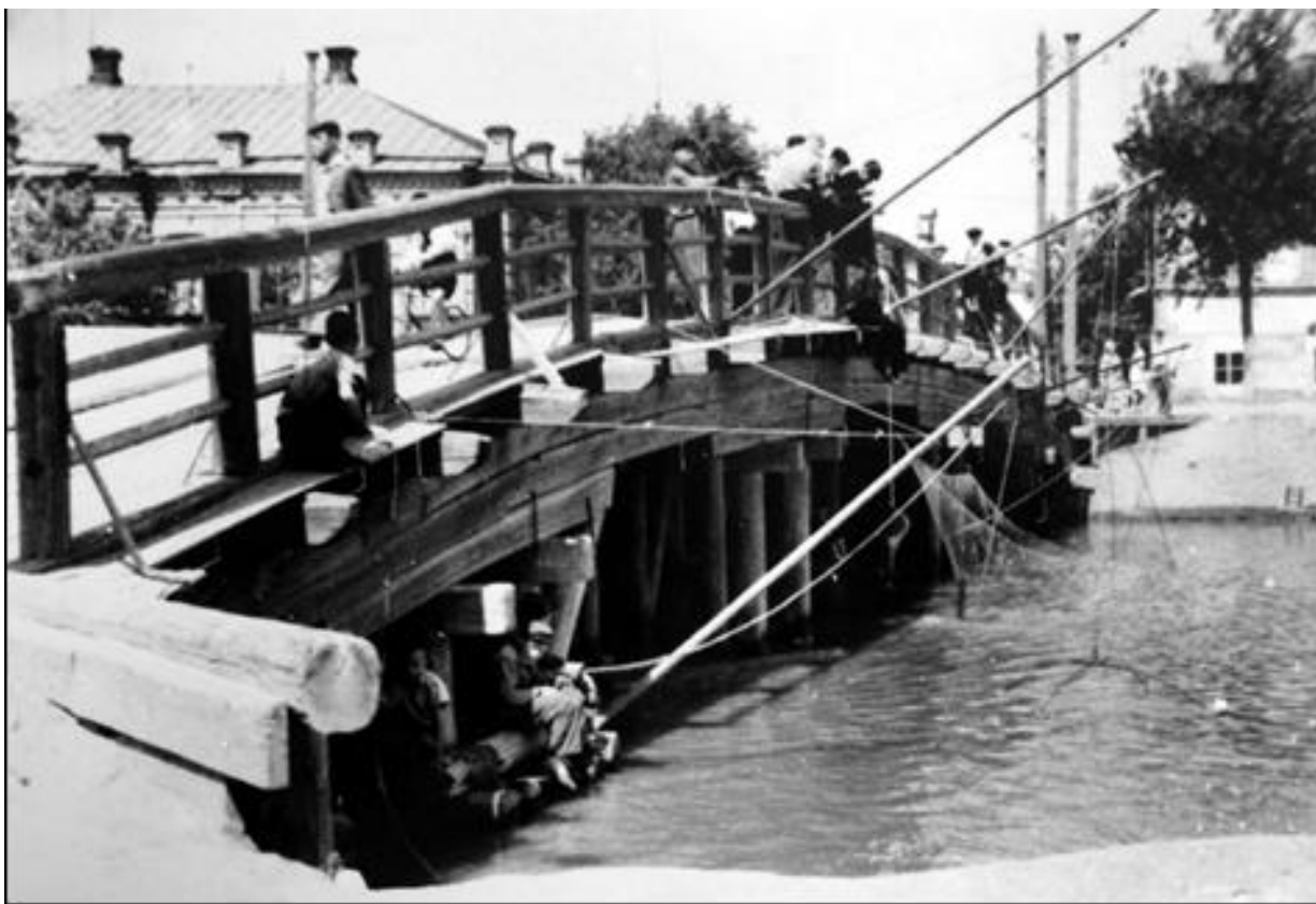
Мост по улице Победы на Канаве

Ставили 4 прута, сетка натягивалась и через блок опускалась в реку минут на пять. Когда поднимали сетку из воды, она была наполнена рыбой. Тогда рыбак кричал во все горло: «Кому рыбы?» — подходили покупатели, выбирали, скажем, судачка, отдавали за 3-5 копеек. Покупателей нет – сетка с живой рыбой снова опускалась в реку. Таким же методом ловли промышляли и рыбаки на лодках, а лодки тогда были почти у всех астраханцев.